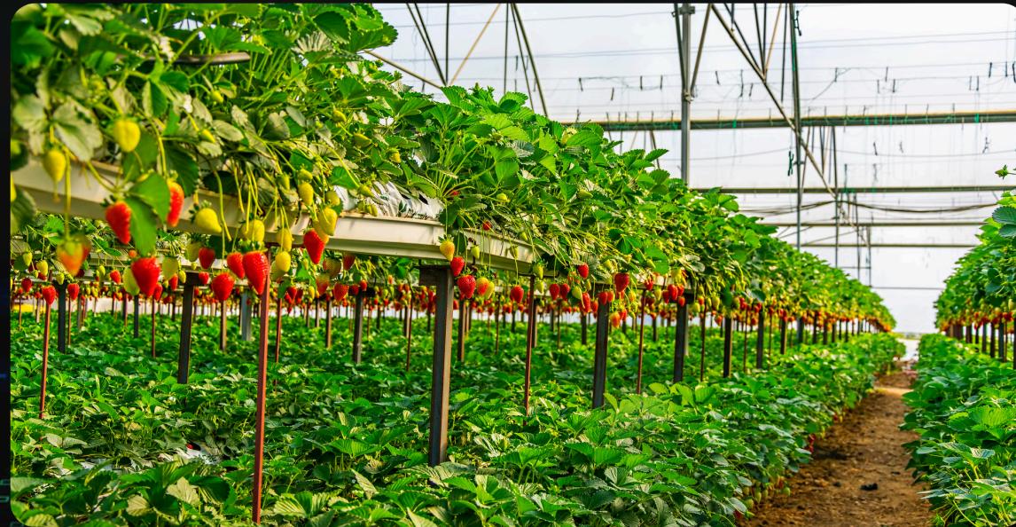
INFRAESTRUCTURA DEL INVERNADERO