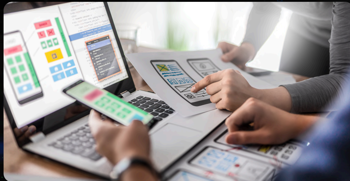
DESARROLLO DE LA APP