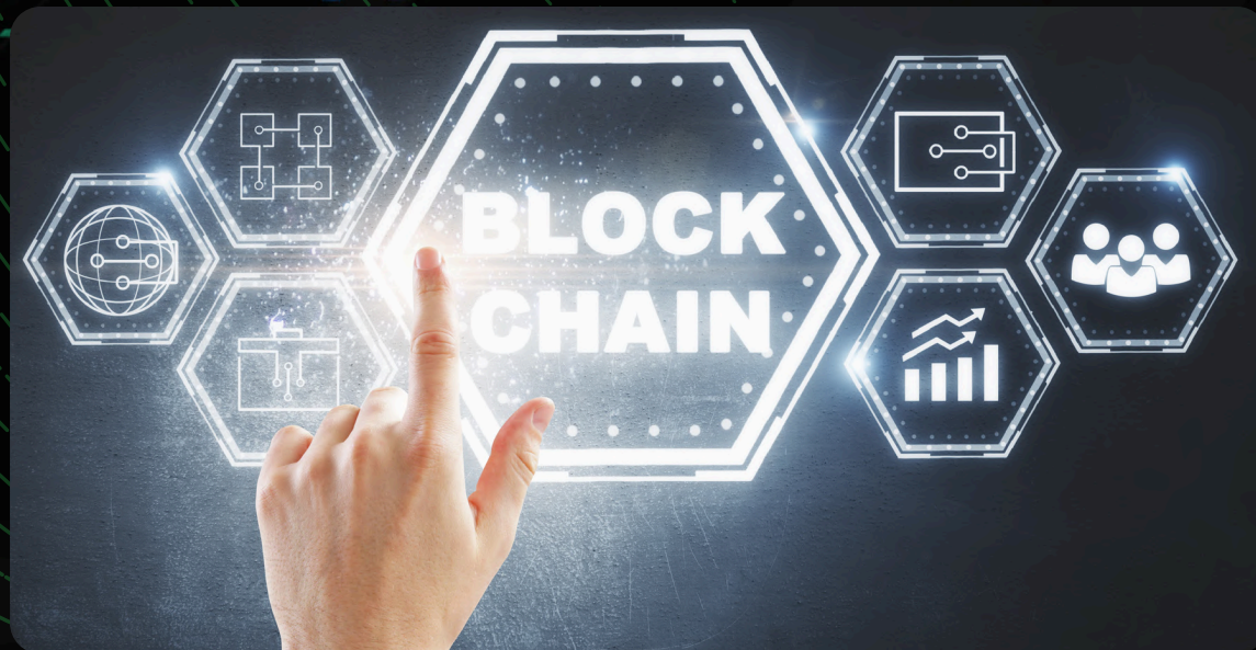
DESARROLLO DE LA BLOCKCHAIN