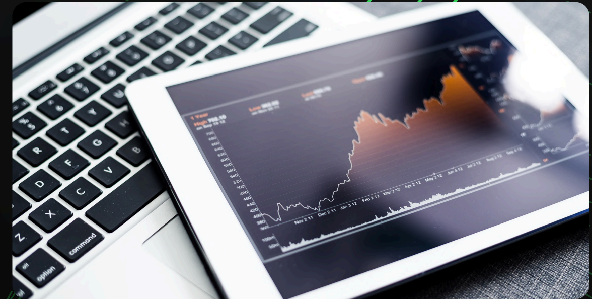
COMERCIALIZACIÓN & MARKETING