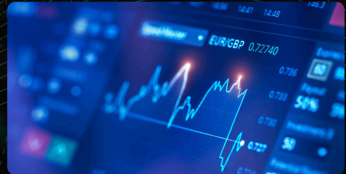
TRADING EN ACCIONES Y MERCADOS DIGITALES