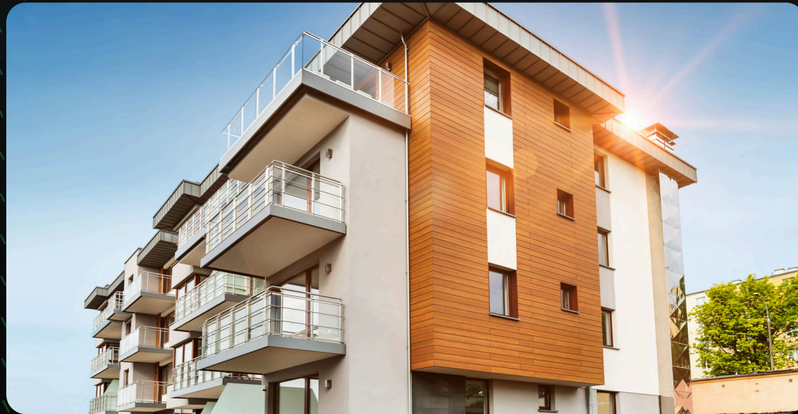
COMPRA DE PROPIEDADES